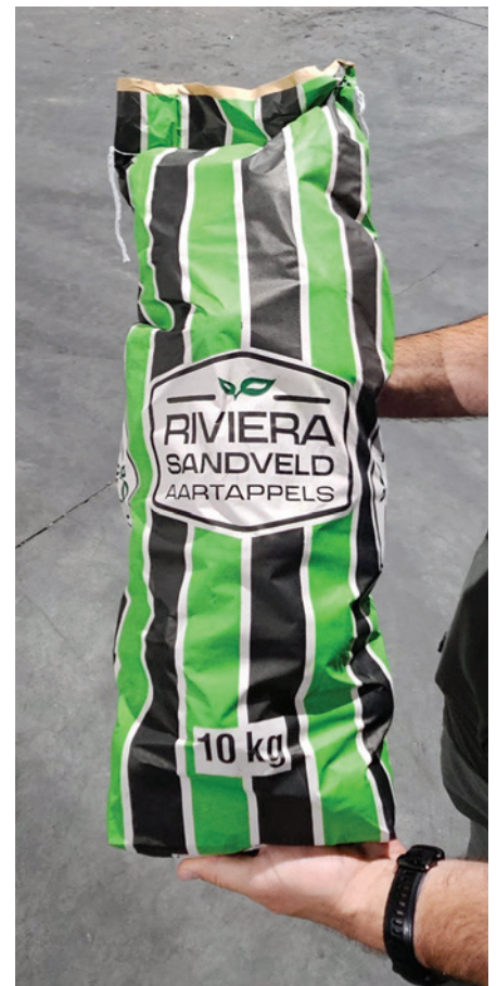
HP Smit en Seuns Boerdery se bekende gestreepte aartappelsakke is ’n waarborg van gehalte. Kopers is bereid om ’n premie vir die aartappels te bepaal, omdat hulle kan vertrou dat die boerdery net gehalte produkte na die mark stuur.

Ongeveer 68% van die totale oes word op varsproduktemarkte in sakkies van 7 en 10 kg bemark. Die res