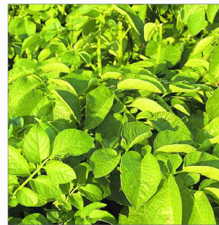
So lyk 'n aartappelplant wat nie afhanklik is van Eskom nie.